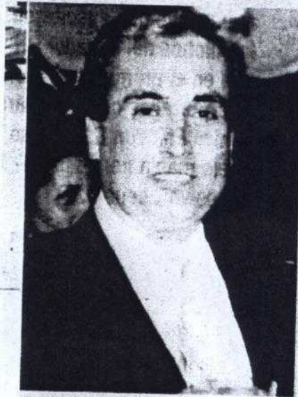
El químico Eugenio Berrios fue asesinado en 1995 en Uruguay.